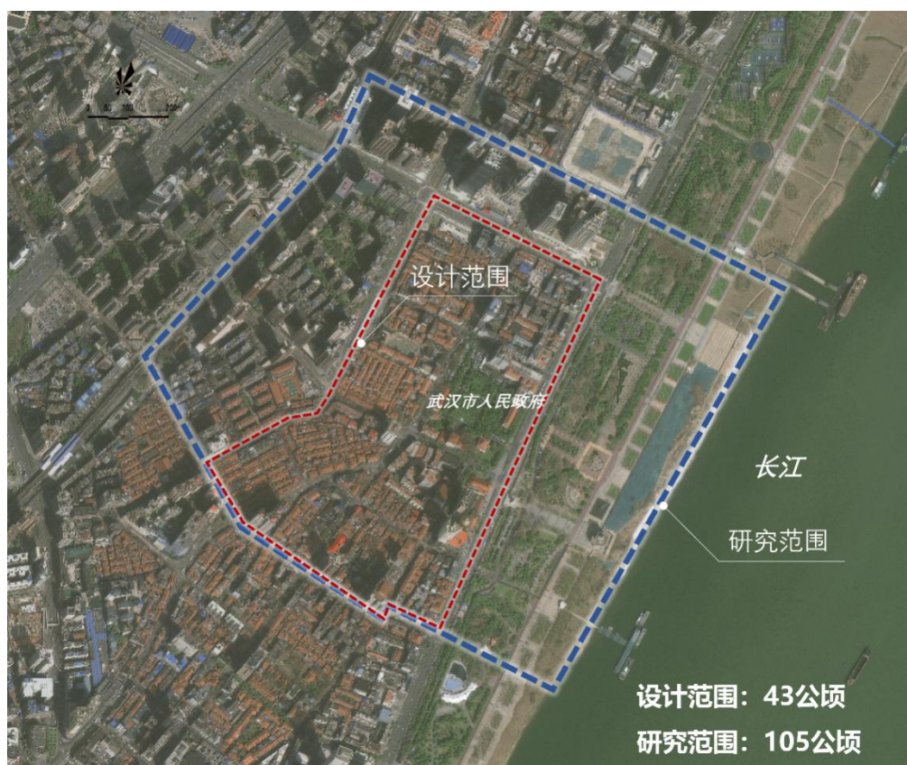
图 3 三阳设计之都片影像图

三阳设计之都片位于武汉市主城区内具有丰厚历史文化资源的汉口滨江区域内，东侧毗邻长江，沿江已建成江滩公园。设计范围由车站路、中山大道、三阳路、沿江大道围合，总面积约 43 公顷；研究范围北至四唯路和麟趾路，南至车站路，西邻京汉大道，东临长江，总面积约 105 公顷。三阳设计之都片现状主要为居住、商务商业、行政办公，片区内工程设计产业基础雄厚，并有大量文物保护单位、优秀历史建筑、不可移动文物、历史保护建筑、里分建筑等历史建筑，片区整体呈现为历史风貌街区。